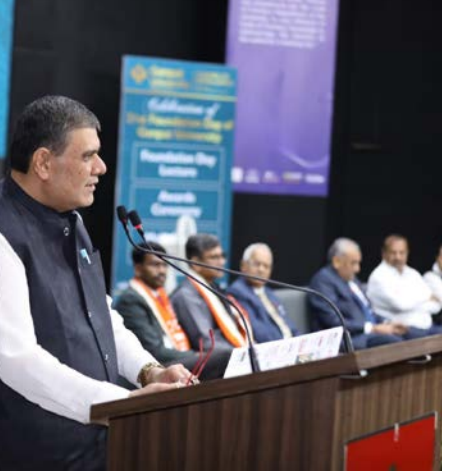
દિવસ વહેલા ઉજવાયેલા તેના સ્થાપના દિવસે ત્રણ અવસરોનું યુનિવર્સિટી દ્વારા આયોજન કરવામાં આવ્યું હતું.

ગણપત યુનિવર્સિટીના આંગણે ગઈ તારીખ ૧૧ના રોજ તેનો ૨૧મો સ્થાપના દિવસ ભારે રંગેરંગે અને ઉત્સાહપૂર્વક રીતે ઉજવાયો હતો. બરાબર ૨૦ વર્ષ પહેલાંના ૨૦૦૫ના વર્ષની ૧૨મી એપ્રિલે ગુજરાત વિધાનસભામાં ગણપત યુનિવર્સિટી માટેનો ખાસ બરડો પસાર થયો અને ગુજરાત સરકાર દ્વારા આ સંસ્થાને યુનિવર્સિટી તરીકેનો દરજ્જો પ્રાપ્ત થયો, ત્યારબાદ કેન્દ્ર સરકારની શૈક્ષણિક સંસ્થા 'યુનિવર્સિટી ગ્રાન્ટ્સ કમિશન' એટલે કે 'યુ.જી.સી.' દ્વારા પણ તેના અધિનિયમ એક-૨ હેઠળ માન્યતા પ્રાપ્ત થઈ જે કોઈપણ યુનિવર્સિટી માટે એક કાનૂની જરૂરિયાત હોય છે.