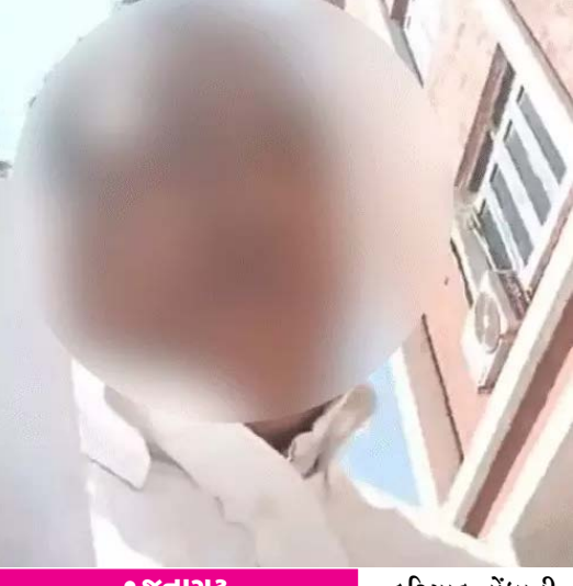
જુનાગઢમાં સરકારી તંત્ર અને જનતા વચ્ચેનો સંઘર્ષ હવે ચરમસીમાએ પહોંચ્યો છે.

જુનાગઢમાં સરકારી તંત્ર અને જનતા વચ્ચેનો સંઘર્ષ હવે ચરમસીમાએ પહોંચ્યો છે. મહાનગરપાલિકામાં ભ્રષ્ટાચાર અને બેદરકારીના વીડિયો ઉતારનાર અરજદારને આ મુદ્દે પોલીસે અરજદાર સામે ગુનો નોંધ્યો હતો. આ સમગ્ર ઘટનાક્રમ બાદ અરજદારે એસપીને લેખિત રજૂઆતમાં જણાવ્યું હતું કે, વીડિયો ઉતારના જોઈ પાનસુરીયા એન્જિનિયર અને અન્ય સ્ટાફે તેમને ઘેરી લીધા હતા. તેમણે આક્ષેપ કર્યો કે, ‘મને માર મારવામાં આવ્યો અને એક કર્મચારીએ પગનું ચપ્પલ કાઢી મારા મોઢા પર વારંવાર પ્રહાર કર્યા હતા. આ દરમિયાન જાતિસૂચક શબ્દો કહી અપમાનિત કરવામાં આવ્યો હોવાનો પણ અરજદારે આક્ષેપ કર્યો હતો. આ હુમલામાં અરજદાર બેભાન થઈ ગયા હતા અને તેમને ૧૧૨ મારફતે સિવિલ હોસ્પિટલ ખસેડાયા હતા.