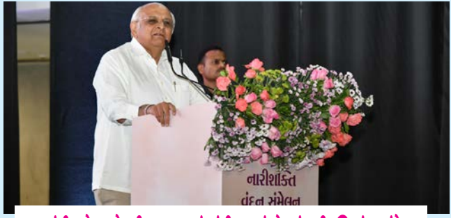
મુખ્યમંત્રી ભૂપેન્દ્ર પટેલની અધ્યક્ષતામાં ગાંધીનગરમાં ચોખ્ખું નારીશક્તિ સંમેલન

સમગ્ર ભારતનું કિસાનો માટેનું એકમાત્ર દૈનિક સમાચાર પત્ર