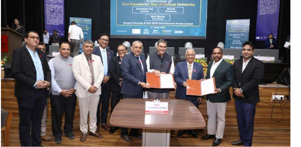
જોડાણોને વિસ્તૃત કરવા અને વિદ્યાર્થીઓને આધુનિક ટેકનોલોજી સાથે સુસંગત એવી અદ્યતન શૈક્ષણિક તકો પુરી પાડવાનો છે.

બીજું MOU ગણપત યુનિવર્સિટી અને ક્યુ-પ્લેયરવોયલ્સ કંપની વચ્ચે સ્થાપન થયું હતું જેનો ઉદ્દેશ પણ ઈનોવેશન, ગુણવત્તાયુક્ત અભ્યાસ-સંશોધન અને ઉભરતી જતી નવી ટેકનોલોજી સહિતનો સેતુ ઉઠાવવાનો છે.