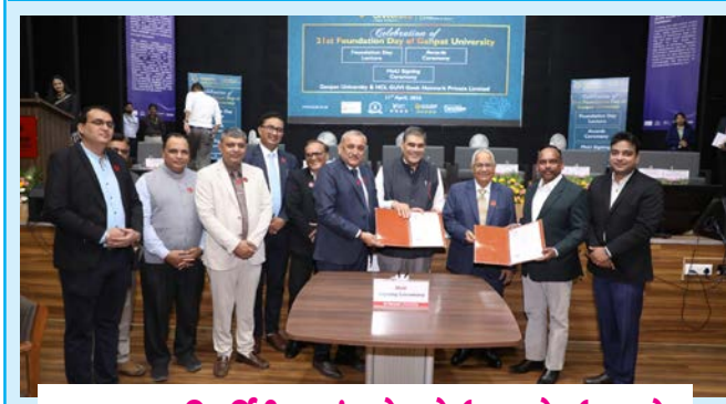
ગણપત યુવિવર્સિટીના આંગણે ભારે ઉત્સાહભરે ઉજવાયો

સમગ્ર ભારતનું કિસાનો માટેનું એકમાત્ર દૈનિક સમાચાર પત્ર