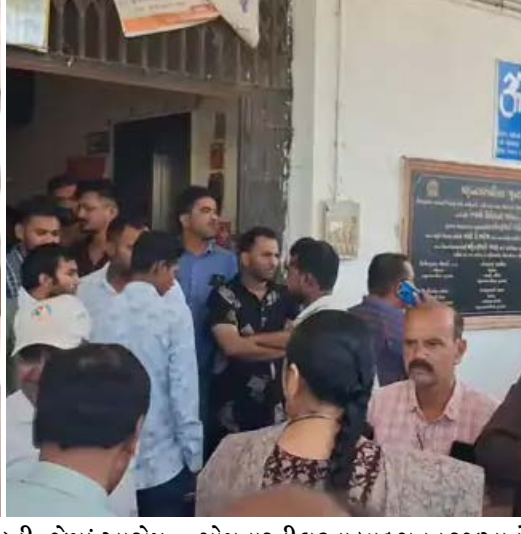
સોમવારની ઘટના બાદ સતત રજૂઆતો કરવા છતાં જ્યારે બી-ડિવિઝન પોલીસ દ્વારા એટ્રોસિટી એક્ટ મુજબ ગુનો નોંધવામાં ન આવ્યો, ત્યારે હતાશ થયેલા અરજદાર આજે ૧૫ એપ્રિલે એસપી કચેરી પહોંચ્યા હતા. તેમણે આક્ષેપ કર્યો હતો કે, પોલીસ માત્ર સત્તાધારીઓ અને સરકારી કર્મચારીઓનું સાંભળે છે, ગરીબ અને અનુસૂચિત જાતિના વ્યક્તિ માટે ન્યાયાના દરવાજા બંધ છે. આ સમયે આ કોશમાં આવી તેમણે ઝેરી દવા પીને જીવન ટૂંકાવવાનો પ્રયાસ કર્યો હતો. જો કે તેમને તાત્કાલિક સારવાર માટે હોસ્પિટલ ખસેડવામાં આવ્યા હતા. આ ઘટનાને પગલે દલિત સમાજમાં પણ ભારે રોષ જોવા મળી રહ્યો છે.

જુનાગઢમાં સરકારી તંત્ર અને જનતા વચ્ચેનો સંઘર્ષ હવે ચરમસીમાએ પહોંચ્યો છે. મહાનગરપાલિકામાં ભ્રષ્ટાચાર અને બેદરકારીના વીડિયો ઉતારનાર અરજદારને આ મુદ્દે પોલીસે અરજદાર સામે ગુનો નોંધ્યો હતો. આ સમગ્ર ઘટનાક્રમ બાદ અરજદારે એસપીને લેખિત રજૂઆતમાં જણાવ્યું હતું કે, વીડિયો ઉતારના જોઈ પાનસુરીયા એન્જિનિયર અને અન્ય સ્ટાફે તેમને ઘેરી લીધા હતા. તેમણે આક્ષેપ કર્યો કે, ‘મને માર મારવામાં આવ્યો અને એક કર્મચારીએ પગનું ચપ્પલ કાઢી મારા મોઢા પર વારંવાર પ્રહાર કર્યા હતા. આ દરમિયાન જાતિસૂચક શબ્દો કહી અપમાનિત કરવામાં આવ્યો હોવાનો પણ અરજદારે આક્ષેપ કર્યો હતો. આ હુમલામાં અરજદાર બેભાન થઈ ગયા હતા અને તેમને ૧૧૨ મારફતે સિવિલ હોસ્પિટલ ખસેડાયા હતા.