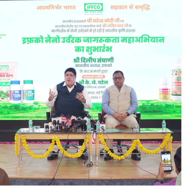
માત્ર ઉત્પાદન નથી, પરંતુ જમીન અને પર્યાવરણની સુરક્ષા તથા ખેડૂતોની આવક વધારવાનો અસરકારક સાધન છે તેમણે કહ્યું, "આપણે મળીને સંકલ્પ કરીએ - ઓછી કિંમત, વધુ ઉત્પાદન અને સ્વસ્થ પર્યાવરણ - દરેક ખેતરમાં નેનો ખાતર આ જ નવું ભારત છે, આ જ આત્મનિર્ભર ભારત છે."

તેમના સંબોધનના અંતમાં શ્રી સંઘાણીએ નેનો મહા અભિયાનને સાચા જનઅંદોલનમાં પરિવર્તિત કરવાની અપીલ કરી તેમણે જણાવ્યું કે નેનો ખાતર