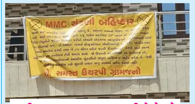
જમીન બચાવવા 10 ગામના રહીશો મેદાને

સમગ્ર ભારતનું કિસાનો માટેનું એકમાત્ર દૈનિક સમાચાર પત્ર