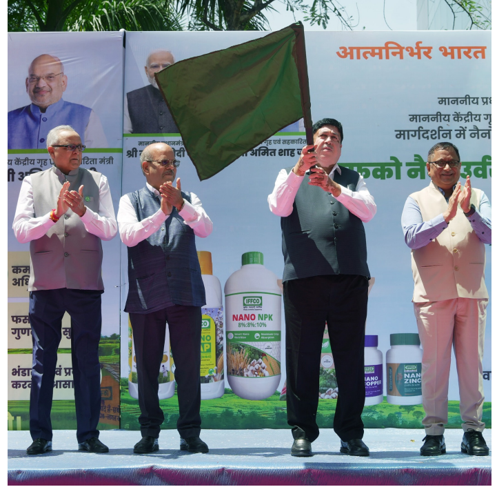
શ્રી સંઘાણીએ નેનો ખાતર ક્રાંતિને ભારતીય કૃષિ માટે પરિવર્તનકારી ઘણા ગણાવી.

ઈફકો ભારતની સૌથી મોટી ખાતર સહકારી સંસ્થા, એ આજે સત્તાવાર રીતે ઈફકો નેનો ખાતર જાગૃતિ મહા અભિયાનનો શુભારંભ કર્યો. આ દરમિયાન ઈફકોના અધ્યક્ષ શ્રી દિલીપ સંઘાણીએ પ્રેસ વાર્તાને સંબોધિત કરતાં જણાવ્યું કે આ એક વ્યાપક અને એકીકૃત રાષ્ટ્રીય જાગૃતિ અભિયાન છે, જેનો હેતુ ભારતીય ખેડૂતોમાં નેનો ખાતરના ઉપયોગને પ્રોત્સાહિત કરવાનો છે. માનનીય પ્રધાનમંત્રી શ્રી નરેન્દ્ર મોદીજી અને માનનીય કેન્દ્રીય ગૃહ અને સહકારિતા મંત્રી શ્રી અમિત શાહજીની પ્રેરણાથી શરૂ કરવામાં આવ્યું છે અને 'આત્મનિર્ભર ભારત' અને 'સહકારથી સમૃદ્ધિ' જેવા રાષ્ટ્રીય મિશન સાથે સુસંગત છે. ભારતના રાજપત્રના ખાતર નિયંત્રણ આદેશ (FCO) માં નેનો NPK લિક્વિડ (8-8-10) ને નેનો NPK ગ્રેન્યુલર (20-10-10) ની ઐતિહાસિક સુચનાને ભારતની કૃષિ નવીનતા યાત્રામાં એક મહત્વપૂર્ણ મીલનો પથ્થર ગણાવવામાં આવ્યો, જે ભારતીય સહકારિતા માટે ગૌરવની ઘણા છે. તેમણે આગળ જણાવ્યું કે કોયમ્બતૂર સ્થિત ઈફકોના નોવેન્શન્સમાં ઈફકોનું ઈનોવેશન હબ અને બ્રાઝીલમાં આવનાર નેનો ખાતર ઉત્પાદન પ્લાન્ટ જે જૂન ૨૦૨૬ સુધી શરૂ થવાનો છે. કૃષિ માટે નેનો ટેકનોલોજીમાં ભારતની વધતી વૈશ્વિક ક્ષમતાનું પ્રતીક છે.