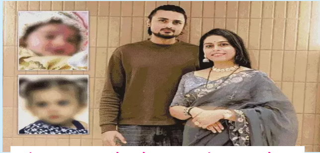
ઢોસાના ખીરાથી થયેલા બે બાળકીના મોતનું રહસ્ય ઘેરાયું