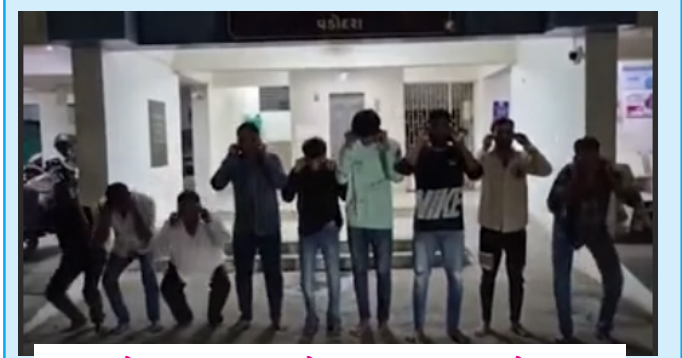
પહેલા ધિંગાણું, હવે કાન પકડી ઉઠાવેલો