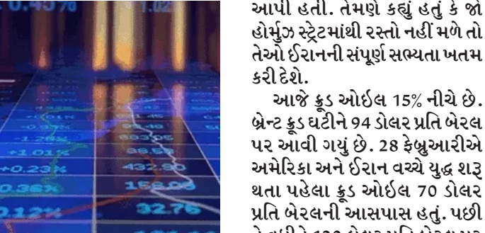
સહમતિ દર્શાવી છે. શેરબજારમાં ગઈકાલે 7 એપ્રિલે સતત ચોથા દિવસે તેજી રહી હતી. સેન્સેક્સ 510 પોઈન્ટ વધીને 74,617 પર બંધ થયો. નિફ્ટીમાં પણ 155 પોઈન્ટનો ઉછાળો રહ્યો, તે 23,124 પર બંધ થયો. આજે IT, મેટલ અને રિયલ્ટી શેરોમાં વધુ ખરીદી જોવા મળી.

અમેરિકા અને ઈરાન વચ્ચે 2 અઠવાડિયાના યુદ્ધવિરામની જાહેરાત બાદ આજે એટલે કે બુધવાર, 8 એપ્રિલે શેરબજારમાં તેજી જોવા મળી. સેન્સેક્સ 2946 પોઈન્ટ (3.95%) વધીને 77,563 પર બંધ થયો. નિફ્ટી પણ 874 પોઈન્ટ (3.78%) ઉપર રહ્યો, જે 23,997 પર બંધ થયો. આજે ઓટો, રિયલ્ટી અને બેન્કિંગ શેરોમાં વધુ ખરીદી જોવા મળી. નિફ્ટીમાં ઓટો, બેન્કિંગ, કન્ઝ્યુમર ડ્યુરબલ્સ અને રિયલ્ટી ઈન્ડેક્સ 5% ઉપર બંધ થયા. અમેરિકા અને ઈરાન વચ્ચે 40 દિવસથી ચાલી રહેલા યુદ્ધ પર 2 અઠવાડિયા માટે વિરામ લાગી ગયો છે. બંને દેશોએ પાકિસ્તાન-ચીનની મધ્યસ્થી બાદ આ યુદ્ધવિરામ પર સહમતિ દર્શાવી છે. શેરબજારમાં ગઈકાલે 7 એપ્રિલે સતત ચોથા દિવસે તેજી રહી હતી. સેન્સેક્સ 510 પોઈન્ટ વધીને 74,617 પર બંધ થયો. નિફ્ટીમાં પણ 155 પોઈન્ટનો ઉછાળો રહ્યો, તે 23,124 પર બંધ થયો. આજે IT, મેટલ અને રિયલ્ટી શેરોમાં વધુ ખરીદી જોવા મળી. શેરબજારમાં ગઈકાલે 7 એપ્રિલે સતત ચોથા દિવસે તેજી રહી હતી. સેન્સેક્સ 510 પોઈન્ટ વધીને 74,617 પર બંધ થયો. નિફ્ટીમાં પણ 155 પોઈન્ટનો ઉછાળો રહ્યો, તે 23,124 પર બંધ થયો. આજે IT, મેટલ અને રિયલ્ટી શેરોમાં વધુ ખરીદી જોવા મળી.