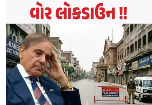
ઘણા રાજ્યોમાં રાત્રે 8 વાગ્યાથી લોકડાઉનની જાહેરાત કરી છે. આમાં પંજાબ, બેંગલ પપ્તુનખ્વા, બલુચિસ્તાન, ઈસ્લામાબાદ, ગિલગિટ-બલ્ટિસ્તાન અને પાકિસ્તાન ઓક્યુપાઈડ કાશ્મીર (PoK) માં બજારો, શોપિંગ મોલ અને તમામ બંધોનો સમાવેશ થાય છે. શાહબાઝ સરકારે જણાવ્યું છે કે ખેંબર પપ્તુનખ્વાના ડિવિઝનલ હેડક્વાર્ટરમાં બજારો અને શોપિંગ મોલ રાત્રે 9 વાગ્યા સુધી ખુલ્લા રહેશે. પરંતુ અન્ય તમામ જનરલ સ્ટોર્સ, ડિપાર્ટમેન્ટલ સ્ટોર્સ અને તમામ પ્રકારના મોલ રાત્રે 8 વાગ્યા સુધીમાં બંધ રહેશે. ઘરમાં કે ફાર્મ હાઉસમાં રાત્રે 10 વાગ્યા પછી લગ્ન સમારોહ યોજવા પર પ્રતિબંધ મુકવાનો પણ નિર્ણય લેવામાં આવ્યો હતો. જોકે, મેડિકલ સ્ટોર્સ અને ફાર્માસીઓને આ પ્રતિબંધોમાંથી બાકાત રાખવામાં આવ્યા છે.