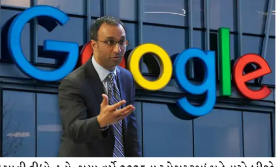
કગવાવી દીધો હતો. ગયા વર્ષે 2025ના ઓગસ્ટમાં મહેતાએ બીજો એક સીમાચિહ્નિત ચુકાદો આપ્યો હતો કે ગુગલે ઓનલાઈન સર્ચમાં પોતાનું વર્ચસ્વ જાળવી રાખવા માટે એન્ટિ-ટ્રસ્ટ કાયદાઓનું ઉલ્લંઘન કર્યું છે. 1971માં ગુજરાતના પાટણમાં જન્મેલા મહેતાને 2014માં તત્કાલીન રાષ્ટ્રપતિ બરાક ઓબામાએ કોલમ્બિયા ડિસ્ટ્રિક્ટ માટે યુએસ ડિસ્ટ્રિક્ટ કોર્ટમાં જજ તરીકે નિયુક્ત કર્યા હતા. મહેતા એક વર્ષની ઉંમરે માતા-પિતા સાથે અમેરિકા ગયા હતા અને 1993માં જ્યોર્જિયાનું યુનિવર્સિટીમાં પોલિટિકલ સાયન્સ અને ઈકોનોમિક્સમાં બી.એ. અને 1997માં યુનિવર્સિટી ઓફ