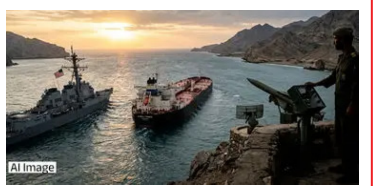
જનતાએ પણ મજબૂતી બતાવી, પરંતુ નેતન્યાહુ રાજકીય અને વ્યૂહાત્મક બંને સ્તરે નિષ્ફળ રહ્યા. લેપિડે એમ પણ કહ્યું કે નેતન્યાહુ તેમના કોઈપણ નિર્ધારિત લક્ષ્યને પ્રાપ્ત કરી શક્યા નથી અને તેમના નિર્ણયોથી થયેલા નુકસાનની ભરપાઈ કરવામાં દેશને ઘણા વર્ષો લાગશે. તેમણે આરોપ લગાવ્યો કે આ સ્થિતિ નેતન્યાહુના અહંકાર, બેદરકારી અને વ્યૂહાત્મક યોજનાના અભાવનું પરિણામ છે. અમેરિકા અને ઈરાન વચ્ચે થયેલા યુદ્ધવિરામ બાદ એક મહત્વપૂર્ણ ખુલાસો સામે આવ્યો છે. મીડિયા રિપોર્ટ્સ નિર્ણયોમાં ઈઝરાયેલને સામેલ જ કરવામાં આવ્યું ન હતું. તેમણે કહ્યું કે સેનાએ પોતાનું કામ સંપૂર્ણપણે કર્યું અને

અમેરિકા અને ઈરાન વચ્ચે 40 દિવસથી ચાલી રહેલા યુદ્ધ પછી આખરે 2 અઠવાડિયાના યુદ્ધવિરામ પર સહમતિ બની ગઈ છે. અમેરિકી રાષ્ટ્રપતિ ડોનાલ્ડ ટ્રમ્પે કહ્યું કે આ નિર્ણય પાકિસ્તાનના વડાપ્રધાન શાહબાઝ શરીફ અને આર્મી ચીફની અપીલ પછી લેવામાં આવ્યો. યુદ્ધવિરામ પહેલાં ટ્રમ્પે ઈરાનને કડક ચેતવણી આપી હતી કે જો હોમુંઝ સ્ટ્રેટમાંથી જહાઝોને સુરક્ષિત રસ્તો નહીં મળે તો તેની આખી સભ્યતા ખતમ કરી દેશે. તેમણે મહત્વપૂર્ણ ઈન્ફ્રાસ્ટ્રક્ચર પર હુમલાની પણ ધમકી આપી હતી. ટ્રમ્પે ટાઈમ્સના રિપોર્ટ અનુસાર, આ ચીલ પાકિસ્તાનની મધ્યસ્થી અને છેલ્લી ઘડીએ ચીનના હસ્તક્ષેપ પછી શક્ય બની. પાકિસ્તાને 2 અઠવાડિયાના યુદ્ધવિરામનો પ્રસ્તાવ મૂક્યો હતો, જેને ઈરાને સ્વીકારી લીધો. સમજૂતી હેઠળ, અમેરિકા અને ઈઝરાયેલ પોતાના હુમલા રોકશે. ઈરાન પણ હુમલા બંધ કરશે. આ દરમિયાન, હોમુંઝ સ્ટ્રેટમાંથી તેલ, ગેસ અને અન્ય જહાઝોની સુરક્ષિત અવરજવર ઈરાની સેનાની મદદથી સુનિશ્ચિત કરવામાં આવશે. આ યુદ્ધવિરામ લેબનોન સહિત અન્ય વિસ્તારો પર પણ લાગુ પડશે. જનતાએ પણ મજબૂતી બતાવી, પરંતુ નેતન્યાહુ રાજકીય અને વ્યૂહાત્મક બંને સ્તરે નિષ્ફળ રહ્યા. લેપિડે એમ પણ કહ્યું કે નેતન્યાહુ તેમના કોઈપણ નિર્ધારિત લક્ષ્યને પ્રાપ્ત કરી શક્યા નથી અને તેમના નિર્ણયોથી થયેલા નુકસાનની ભરપાઈ કરવામાં દેશને ઘણા વર્ષો લાગશે. તેમણે આરોપ લગાવ્યો કે આ સ્થિતિ નેતન્યાહુના અહંકાર, બેદરકારી અને વ્યૂહાત્મક યોજનાના અભાવનું પરિણામ છે. અમેરિકા અને ઈરાન વચ્ચે થયેલા યુદ્ધવિરામ બાદ એક મહત્વપૂર્ણ ખુલાસો સામે આવ્યો છે. મીડિયા રિપોર્ટ્સ નિર્ણયોમાં ઈઝરાયેલને સામેલ જ કરવામાં આવ્યું ન હતું. તેમણે કહ્યું કે સેનાએ પોતાનું કામ સંપૂર્ણપણે કર્યું અને