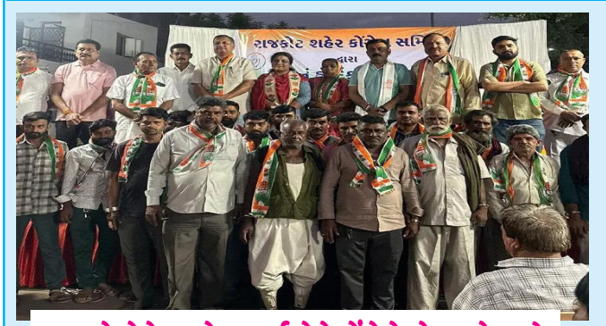
ભાજપે જેને સસ્પેન્ડ કર્યા તેને કોંગ્રેસ ખેસ પહેરાયો

સમગ્ર ભારતનું કિસાનો માટેનું એકમાત્ર દૈનિક સમાચાર પત્ર