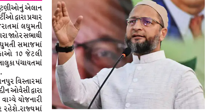
આવશે. અસદુદ્દીન ઓવૈસી અમદાવાદમાં ગુજરાતના નેતાઓની સાથે મુલાકાત કર્યા બાદ સાંજે 7:00 વાગ્યાની આસપાસ ખાનપુરના જે.પી. ચોક ખાતે જાહેર સભાને સંબોધન કરવાના છે. ગત વિધાનસભા અને મ્યુનિસિપલ કોર્પોરેશનની ચૂંટણીમાં પણ ખાનપુર ખાતે સભાને તેઓએ સંબોધન કર્યું હતું.

ગુજરાત રાજ્યમાં સ્થાનિક સ્વરાજ્યની ચૂંટણીઓનું એલાન થઈ ચૂક્યું છે ત્યારે અમદાવાદમાં રાજકીય પાર્ટીઓ દ્વારા પ્રચાર પ્રસારની શરૂઆત કરવામાં આવી છે. ગુજરાતમાં લઘુમતી વિસ્તારોમાં પ્રભુત્વ ધરાવનાર AIMIM પાર્ટી દ્વારા જાહેર સભાથી પ્રચાર શરૂ કરવામાં આવશે. ગુજરાતમાં લઘુમતી સમાજમાં પ્રભુત્વ ધરાવનારા પાંચ મહાનગરપાલિકાઓ 10 જેટલી નગરપાલિકાઓ તેમજ જિલ્લા પંચાયત અને તાલુકા પંચાયતમાં 630 જેટલા ઉમેદવારો ઉભા રાખવામાં આવશે.