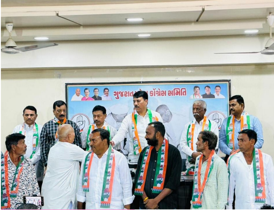
અમદાવાદ, તા. 4

જિલ્લા પ્રમુખો, તાલુકા પ્રમુખો અને પ્રભારીઓ સાથે બેઠક કરીને દરેક સીટ માટે છણાવટ કરી ચર્ચા કરવામાં આવી છે